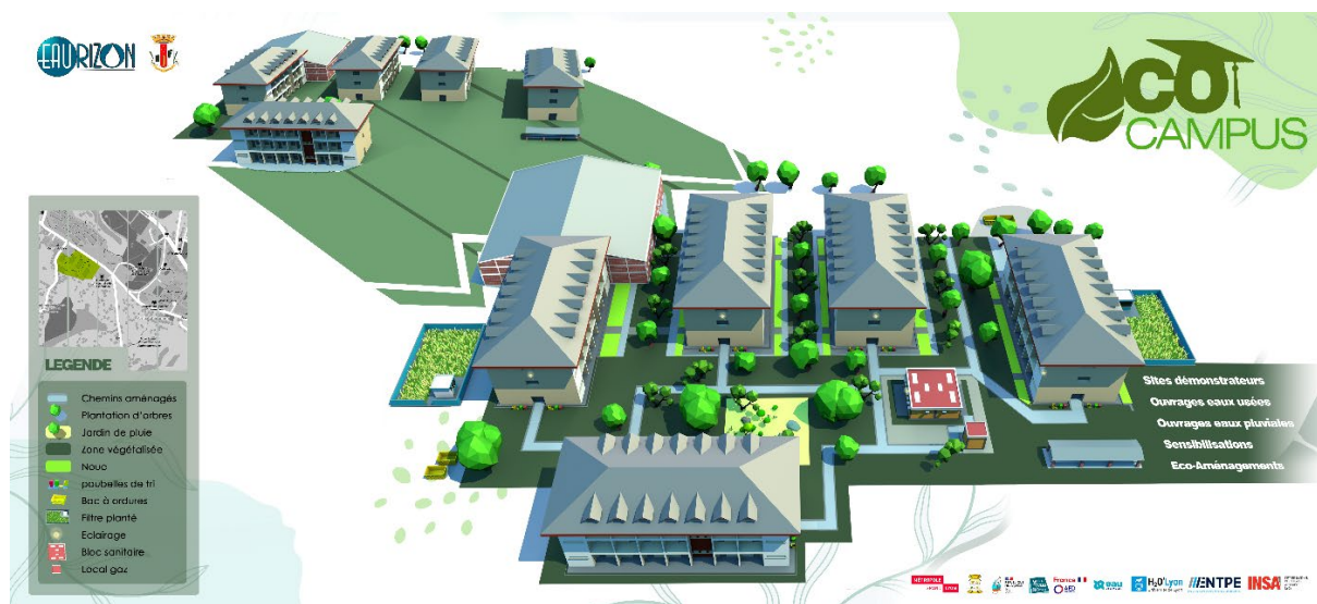
Illustration de la zone vitrine à aménager sur le campus de Fianarantsoa, Madagascar

Les étudiants sont impliqués dans l'élaboration d'un concept élargi d'éco-campus, en participant à l'analyse, à la production d'hypothèses et à la formulation de propositions. Leur contribution favorise l'appropriation du processus de transition et renforce la dimension pédagogique du projet. Des ateliers thématiques ou des consultations communes feront l'objet des réflexions de co-construction.